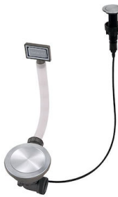
Vidange automatique Space Push - PP 8407 116